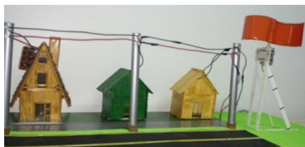
Figura 1 – Torre de energia elaborada para iluminação de três residências

Observa-se que os títulos de ilustrações devem ser centralizados e em tamanho 12, enquanto as respectivas fontes devem apresentar alinhamento centralizado e tamanho 10, adotando-se o espaçamento simples em todos esses elementos. As fontes das ilustrações devem obrigatoriamente terminar em ponto final, como a figura 1.